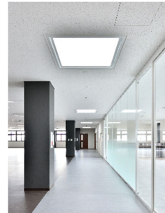
光ダクトによる採光