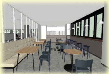
BIM 内観パース(リフレッシュルーム)