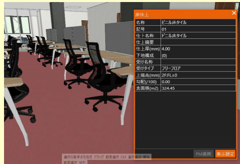
内装データの一例: 2階執務室の床材に関して