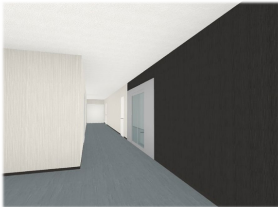
【 1階エントランス3Dパース 】(※2)