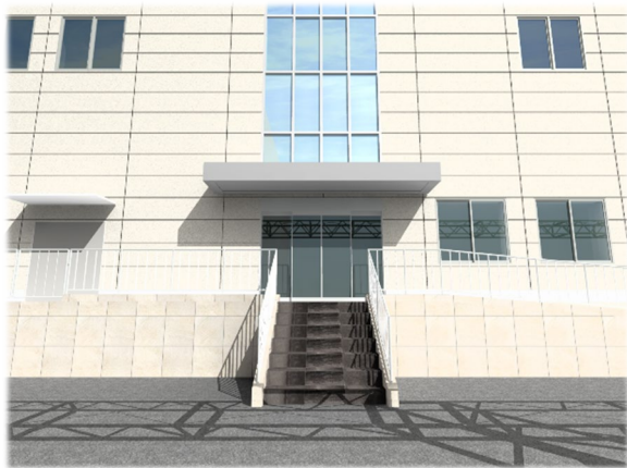
【 正面玄関 3Dパース 】(※1)