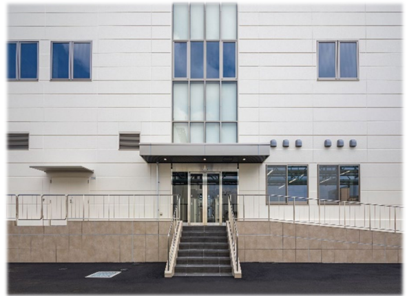
【 正面玄関 外観 】