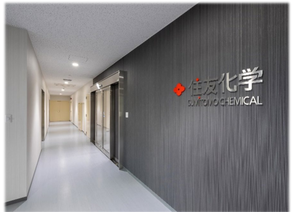
【 1階エントランス 】