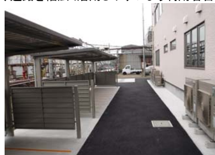
南側 : 自転車置場