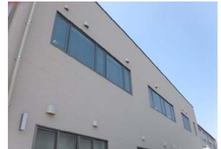
2階南面 遮光フィルム