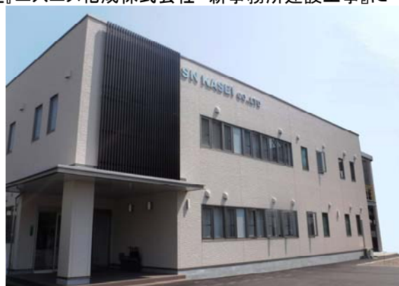
【正面入口(北側)からの外観】

建設場所：住友化学(株)愛媛工場大江地区内 構造規模：鉄骨造 2階建て 延床面積：645.34㎡ 建築面積：337.01㎡