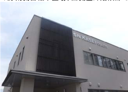
北側 : 化粧ルーバー

前面道路から事務所まで距離がある為、来客者からも視認しやすい化粧ルーバーを採用し、外観にアクセントを加えました。南側自転車置場、西側屋外階段部では、通路を幅広く活用しやすいよう利用者目線で設計しております。