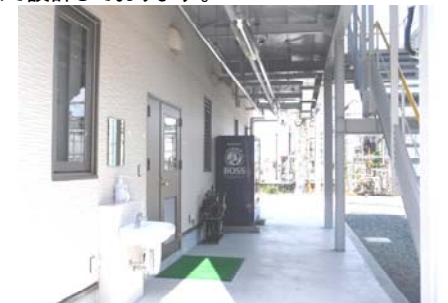
西側 : 屋外通路