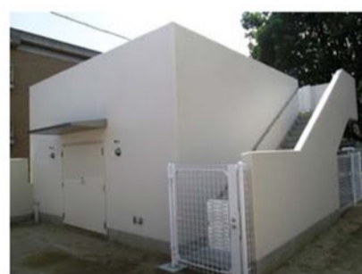
津波対策の避難倉庫

弊社は今後共、進行する少子高齢化社会のお役に立つ施設の設計・監理業務に取り組んでまいります。